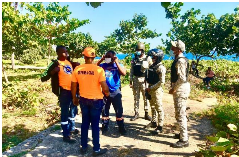
Personal de la Defensa Civil, junto a miembros de la Armada Dominicana y el Cuerpo de Bomberos de Santo Domingo Este, participan en la búsqueda de un pescador que cayó a aguas del Mar Caribe en las inmediaciones de la Avenida España.