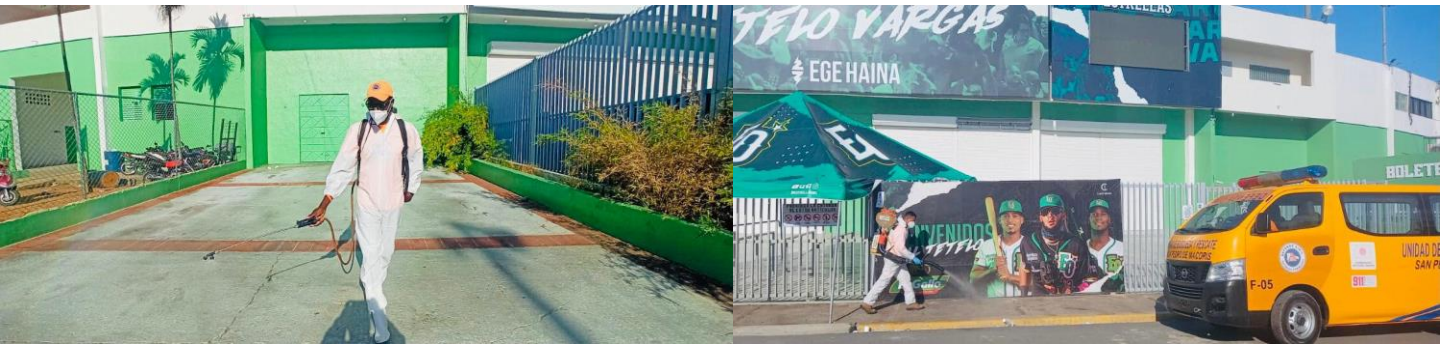
Jornada de desinfección en el Estadio Tetelo Vargas, en San Pedro de Macorís.