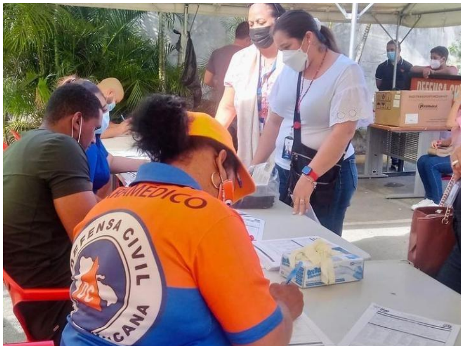
Hospital Materno Infantil Santo Socorro, Santo Domingo

El personal médico y voluntario de la Defensa Civil continúa apoyando las distintas jornadas de vacunación masiva contra el COVID-19 que realiza el Ministerio de Salud Pública, a través de sus Direcciones Provinciales. Además, participa en las tomas de muestras de PCR y Antígenos.